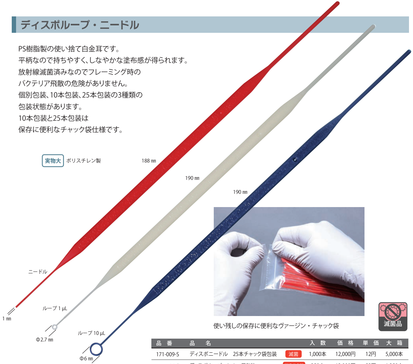
使い残しの保存に便利なヴァージン・チャック袋