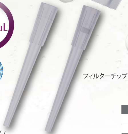
フィルターチップ