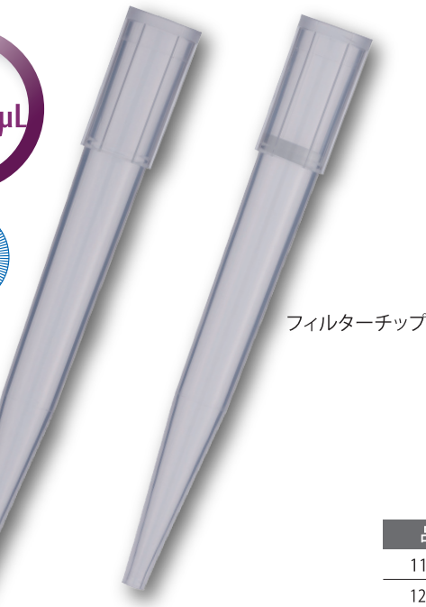
フィルターチップ