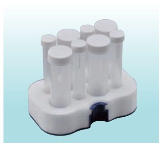
15mL・50mL遠沈管各4本立て