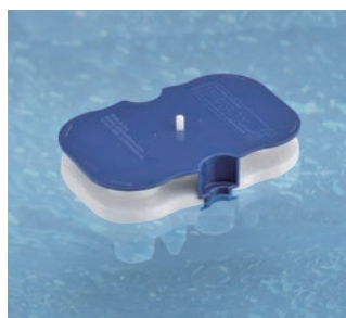
フローターとしても使えます