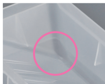
洗しやすい角丸形状。